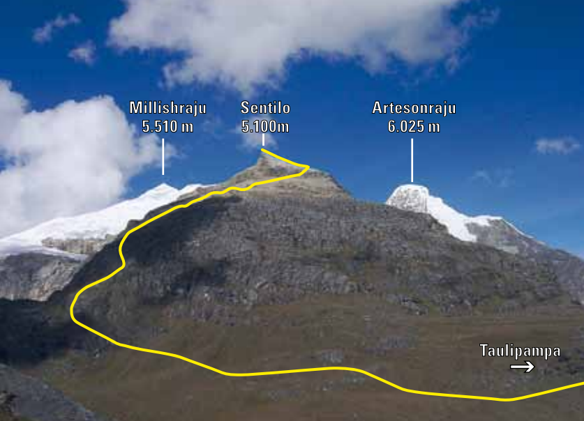
Ascensión al Cerro Sentillo.