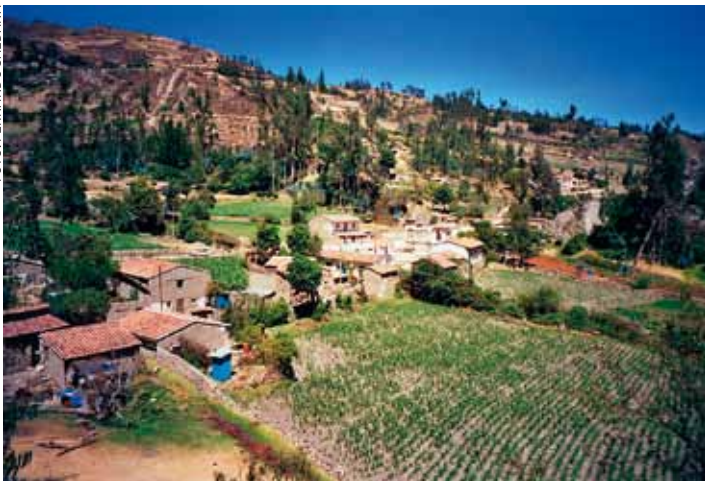
Cashapampa, inicio del trekking

visibles perfectamente los nevados Caraz hacia el oeste. Aquí el sendero cruza un pequeño bosque de quenuales hasta alcanzar la salida de aguas de la laguna Jatunchocha (4.000 m, km 14,4). Pasada la laguna el camino empieza a ascender más fuertemente, pasando junto a algunas cascadas hasta cruzar el río por un puente, ya cerca de la confluencia con la quebrada Arhuaycocha ( 4.175 m, km 19,2 ). Aquí existe la posibilidad de subir hasta la laguna Arhuaycocha a 4.300 m, y observar de cerca los nevados Quitaraju y Alpamayo en el lugar donde se ubica el campo base para los que quieren ascender a estas cimas ( km 22,3 y 2 h ida y vuelta ).