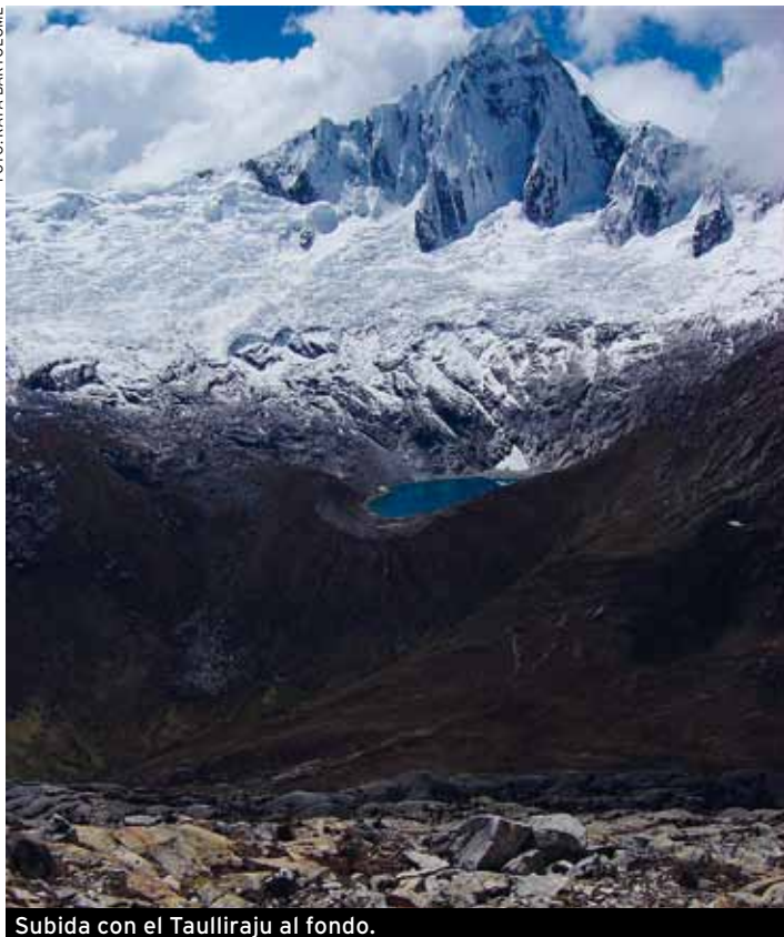
Subida con el Tauliraju al fondo.