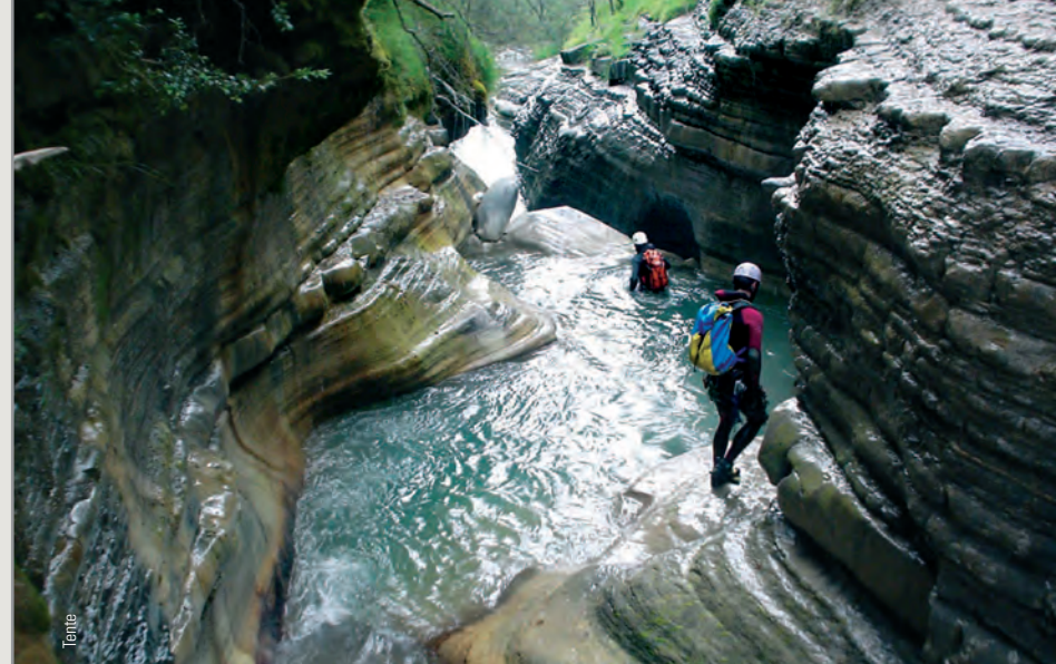
Formas pulimentadas en las capas alternantes de flysch.

Un largo pasillo nos recibe, pequeños resaltes y toboganes nos conducen hasta la represa. Aunque el barranco gana enteros a partir de aquí, la zona previa no deja de tener interés. Pronto llegaremos al puente de Fragen y sus atenuados vertidos, todo un ejemplo del estado de nuestros ríos. Saltos, toboganes, rápeles, y chocamos de frente con una vía ferrata que acribi-