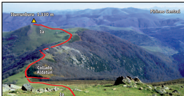
Iturrunburu y Collado Aldatún desde el Adi.

De regreso al collado, seguimos la loma herbosa en el otro lado (ENE) hasta toparnos con un resalte calcáreo cubierto de bosque. La senda lo evita por la izquierda (marcas GR) y accede a los pastizales del otro lado, donde una zona plana a la izquierda de la divisoria permite acercarse al evidente resalte del Iturrunburu; por él nos erguimos (N) hasta su cima (Iturrunburu, 1.330 m, 2 h 40 min) . Buzón. Descendemos unos metros sobre la ruta de subida hasta un caballete en la alamburada que aparece al pie de la cuesta cimera. Lo cruzamos (izquierda) y nos dejamos caer (ENE) ladera abajo hasta dominar el valle. Se aprecia una fuente al aplomo de la cumbre de Iturrunburu, donde repondremos agua (fuentes de Sorogain) y desde la que tomaremos la ladera de su margen izquierda como mejor modo de alcanzar el fondo del valle de Sorogain, aproximadamente un kilómetro por debajo del collado fronterizo de Aztakarri-Aztakarri Lepoa. La pista nos devuelve hasta el punto de partida (860 m, 3 h 35 min) .