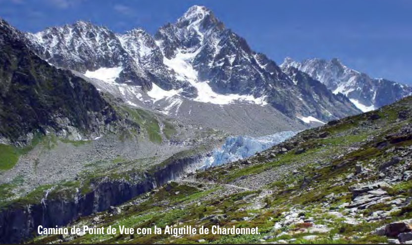
Camino de Point de Vue con la Aiguille de Chardonnet.