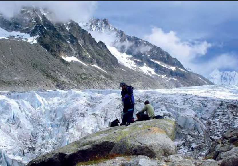
Point de Vue.

desviación que desciende al glaciar y al refugio de Argentière (km 2,8; 2.289 m; 32T 0342270 – 5092269). Seguimos de frente, dejando a nuestra derecha el camino que se dirige hacia el refugio, y llegamos a una zona más llana en la que hay un hito de piedra, Point de Vue (km 3,2; 2.353 m; 32T 0342388 – 5092037). La panorámica