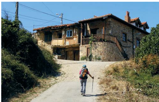
Llegando a Rases.

N 43° 10' 12,6" y WO 04° 37' 31,9""); aquí encontramos un cruce y avanzamos por la pista que sale a nuestra izquierda. Apenas pasados doscientos metros hay una bifurcación (km 3,8; altura 735 m; N 43° 10' 15,3" y WO 04° 37' 41,5""); de nuevo seguimos por la izquierda, ascendiendo hasta los repetidores del Nogalón (km 4,2; altura 777 m; N 43° 09' 58,5" y WO 04° 37' 46,6""). Este primer balcón lebaniego ofrece buenas vistas de los valles de Cillorigo, Cabezón y Camaleño, así como de diferentes cumbres que rodean Liébana y que van a jalonar este periplo lebaniego.