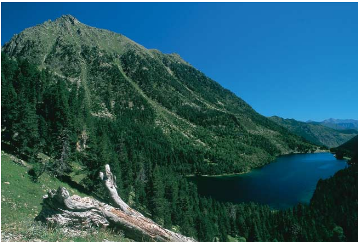
Estany de Sant Maurici.

La primera belleza natural es el estany de Ratera, espejo immaculado de las cumbres desnudas de las Agujas de Bassiero. Nada más dejar atrás el lago hay que tomar un carril a la izquierda en dirección al Portarró; por la derecha se llega al refugio de Amitges,