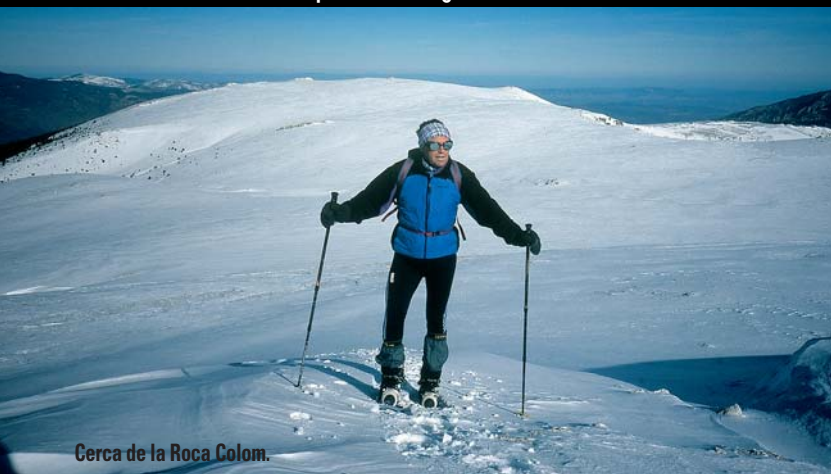
Cerca de la Roca Colom.

Desde el Coll de Mentet por el Pla Segalar