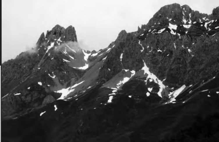
Entorno del puerto de Pandetrave con las torres del Friero y Hoyo de Liordes.

margen del valle (O, trazas de pista ya desdibujadas), encontramos la majada de Pedabejo (1.690 m; 1 h 50 min).