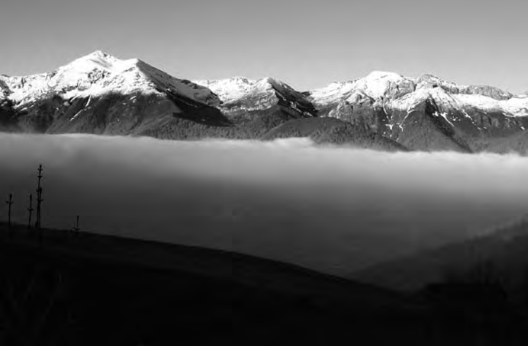
Visión del Corisco en la subida por los Invernales de Igüedri.

tamente en compañía de una orientación global sobre el paisaje, pero no así en ausencia de visibilidad (atención a los bruscos cambios de tiempo, frecuentes en los Picos), momento en que las referencias de orientación pueden ser insuficientes para conseguir seguir la línea de hitos.