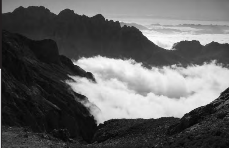
Luces y sombras desde los Urrieles sobre la Liébana.

la majada de Bustantivo (cartel), mientras que la pista de la horcada de Valcavao gira a la derecha en fuerte pendiente para surcar un hayedo donde se eleva hasta el pie de la Peña Remoña. Cruzamos ahora a nuestra izquierda y ya con menor pendiente, hasta salir del arbolado en una media ladera de prados donde hemos de cruzar varias vaguadas provenientes de la montaña. Antes de la más importante de ellas surge a la derecha un ramal de pista secundario por el que accederíamos hacia la majada de Pedabejo y la vega de Liordes (1.540 m; 1 h 25 min; cartel). Hoy nuestra ruta no lleva esa dirección, y sí continúa la traza principal que sigue atravesando a la izquierda hasta finalmente cruzar la torrentera principal que baja del Cabén de Remoña y empezar a ascender en la otra vertiente del valle. Allí describiremos una amplia revuelta a izquierda y derecha hasta ganar la sufrida campearra de la horcada de Valcavao (1.790 m; 2 h 35 min), paso natural hacia el valle de Valdeón.