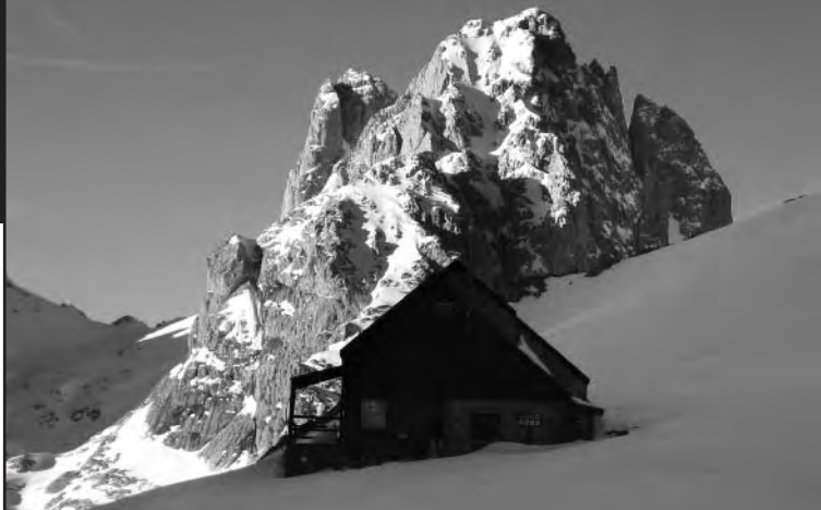
Refugio de Collado Jermoso y torre del Friero en Iontananza.

Los Urrieles nos ofrecen una elevada meseta de roca calcárea, horadada en numerosas depresiones ( jous ), sobre la que despuntan estilizadas torres de verticales paredes. Esos accidentes geográficos se entrelazan unos con otros mediante un sinfín de aristas, espolones y agujas secundarias que conforman un muestrario de vertientes, a la vez que dibujan atractivas líneas de ascensión hacia las cumbres.