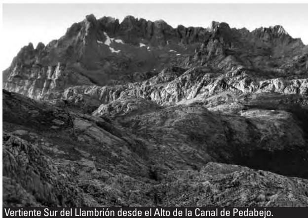
Vertiente Sur del Llambrión desde el Alto de la Canal de Pedabejo.

Antes de coronar el paso, una bifurcación a la izquierda (cartel) da acceso al ramal que continúa cabalgando en las inmediaciones de la divisoria hasta el descenso sobre la estrecha collada del Cabén de Remoña (1.775 m; 1 h 20 min; 43^{\circ}08.460'N 004^{\circ}51.413'O ), final de pista al pie del inequívoco resalte donde se inician los Picos de Europa.